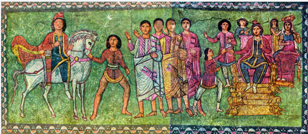
ציור קיר מבית הכנסת ברורה אירופוס (המאה ה-5, סוריה). מימין אסתר ואחשוורוש, ומשמאל מרדכי במעיל מלכות והמן בבגדים בזויים. באמצע ארבע דמויות שנראות כהלניסטיות, כנראה מייצגות את יהודי דורה אירופוס.

הפסקה כולה ערוכה כנגד פרק ג, למשל, שם נאמר: "וַהֲדַת נְתַנָּה בְּשׁוֹשַׁן הַבִּיָּרָה... וְהָעִיר שׁוֹשַׁן