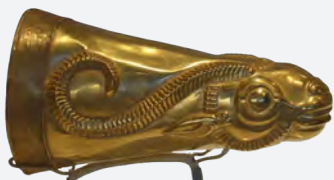
וְהִשְׁקוֹתוֹ בְּכֵלֵי זָהָב וְכֵלִים מְפָלִים שׁוֹנִים – גביעי יין מוזהבים וענקיים מעתיקות האימפריה האחמנית בפרס.

"אָמַר רַבִּי לִוִּי: כִּף הָיָה טַכְסִיס [=טקס] שֶׁל [אנשי] פָּרַס, שֶׁהָיָה לָהֶם כּוֹס גְּדוֹל מִחֲזִיק שְׁלִשִׁים שְׁמִינִיּוֹת, וְהוּא נִקְרָא פִתְקָא, וְהֵם מְשַׁקִּים בּוֹ לְכָל אֶחָד וְאֶחָד, אֲפֵלוּ הוּא מֵת אֲפֵלוּ הוּא מְשַׁתַּגֵּעַ הוּא שׁוֹתֵה. וּמִי שֶׁהוּא שָׂר הַמְּשַׁקִּים הָיוּ גְדוֹלֵי פָּרַס מְעֻשְׂרִין אוֹתוֹ [בשוחד], שֶׁ הַגְּדוֹלִים שֶׁל מְסַבִּין רוֹמְזִים